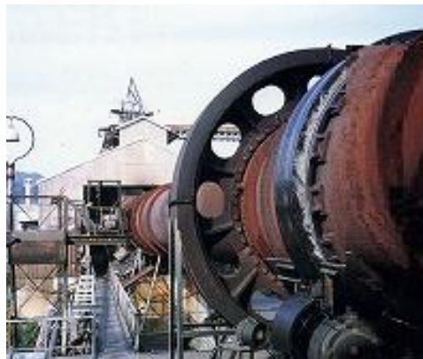
図4. 小野田化学の焼成りん肥用ロータリーキルン