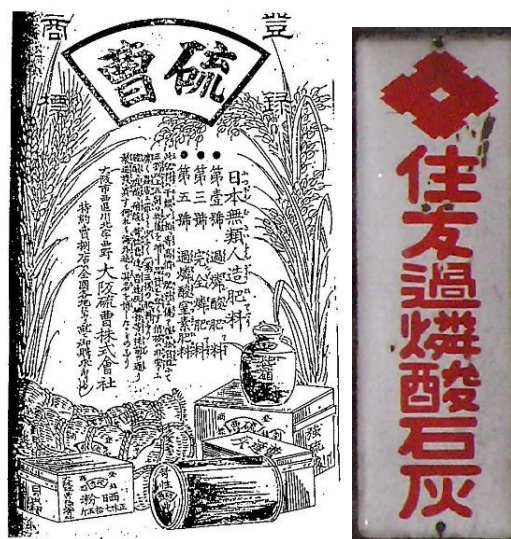
図 2. 過りん酸石灰肥料の広告と看板