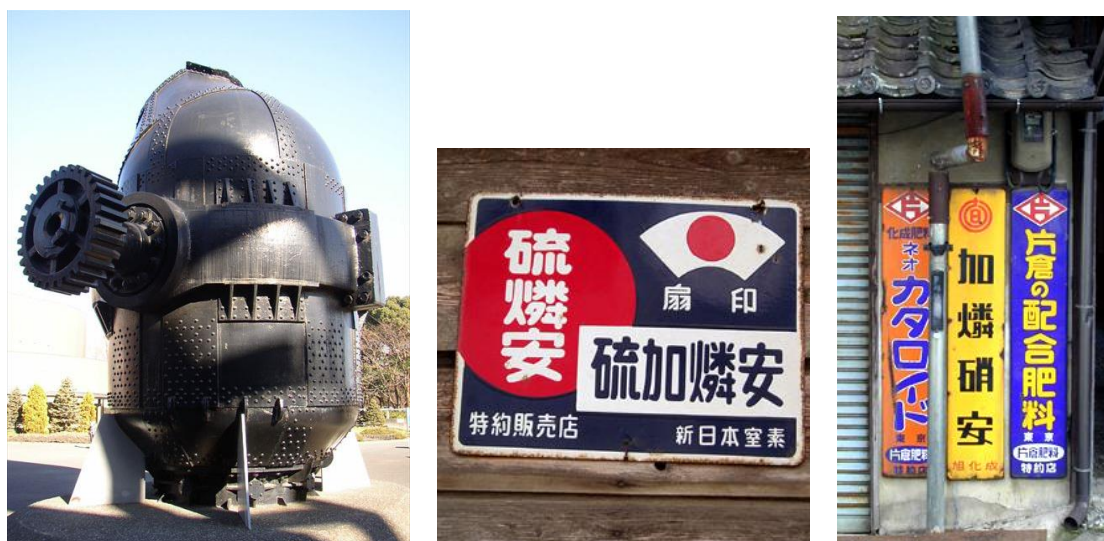
図5. 日本鋼管京葉製鉄所のトーマス転炉

急激に減少し、1960年代初期からトーマスりん肥が完全に姿を消した。図5は日本鋼管京葉製鉄所で1937年から1957年まで使われていたトーマス転炉の写真である。