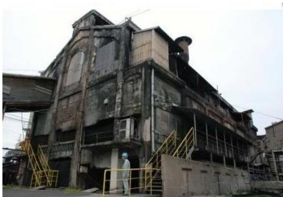
図3. 南九州化学の熔成りん肥工場