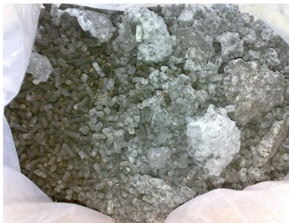
図 2. カビが発生し腐敗した有機入り化成肥料