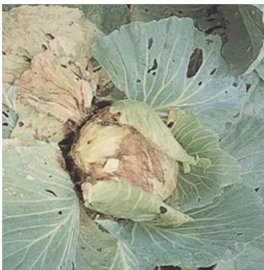
図 5. キャベツの軟腐病

細菌による植物病害の種類が多くない。よく見られたのは軟腐病、青枯病、斑点細菌病などである。菌糸がないため、真菌のように菌糸を伸ばして作物の細胞内に侵入することができず、茎葉の擦り合いで生じた傷口、葉の気孔など自然開口部、あるいは真菌や線虫が付けた傷口から侵入する。一般的に細菌による病気は寄主特異性があり、特定の作物しか寄生しない。植物に侵入後、細胞内または細胞間で増殖して、植物にダメージを与える。図 4 はキャベツの軟腐病、図 5 はトマトの青枯病の症状である。