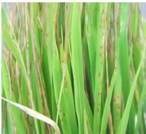
図 3. イネのいもち病

真菌による植物病害の種類が一番多い。よく見られた真菌の病害は灰色カビ病、うどん粉病、白絹病、菌核病、白紋羽病、炭疽病、萎凋病、苗立枯病、根腐病などである。真菌の繁殖と蔓延には高温多湿の環境が必要で、主に6~7月の梅雨時期や9月の秋雨時期に発生しやすくなる。伝染経路は主に真菌の胞子または菌糸が作物の葉や根等に付着して菌糸を伸ばし作物の細胞内に侵入する。作物の過繁茂や生育不良などの場合は葉の表皮にあるクチクラ層が薄くなって、病原菌の侵入を招きやすいうえ、侵入した菌糸も増殖しやすく、病状の進行が速くなる。図3はイネのいもち病、図4はキュウリのうどん粉病の症状である。