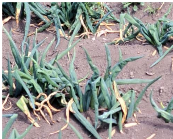
図8. 長ネギの萎縮病

ウイルスによる植物病害には有効な薬剤が全くない。化学的防除によるウイルス病の発症と増殖を抑制することには期待できないが、農薬散布によるヨコバイ、アブラムシなどの