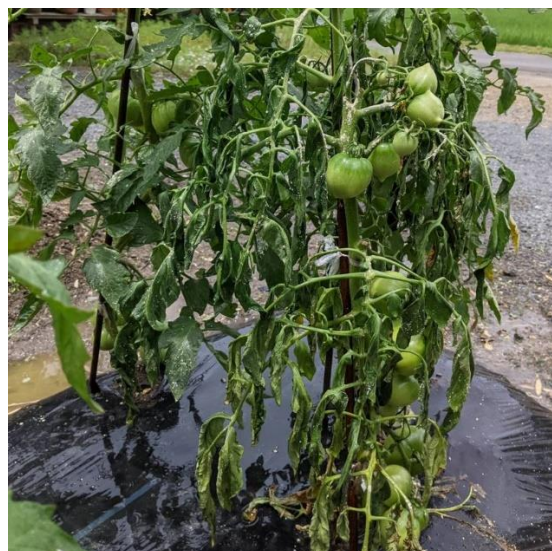
図 6. トマトの青枯病

細菌の感染と増殖には多湿の環境が必要であるが、植物体内に侵入されれば、細胞内の環境に影響される。感染してから植株全体を腐らせ枯らす性質があり、発生を確認した場合にはまん延を防ぐため、植株全てを処分する必要がある。