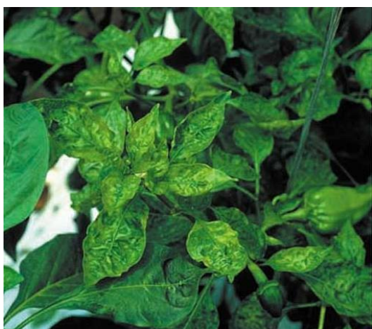
図7. ピーマンのモザイク病

ウイルスによる植物病害の種類が多いが、感染してから発症して、植物の生育を阻害するまでに相当な時間が必要である。通常、栽培期間の短い作物にはウイルスによる被害がほとんど見られない。大体トマト、キュウリのような栽培期間の長い野菜や果樹に発生する。よく見られるウイルス病はモザイク病と萎縮病、わい化病である。ウイルスは菌糸がないため、直接作物の細胞内に侵入することができず、何かの外部の助けが必要である。ウイルスの伝播方式は汁液伝染、種子伝染、接触伝染、土壌伝染、虫媒伝染、接木伝染などがあり、ヨコバイ、アブラムシなどの虫によって虫媒伝染がもっとも多い。感染した植物はウイルスが植物体内に広がるので、挿し木や接ぎ木の栄養繁殖では次の世代にも伝染する。図7はピーマンのモザイク病、図8は長ネギの萎縮病の病状である。