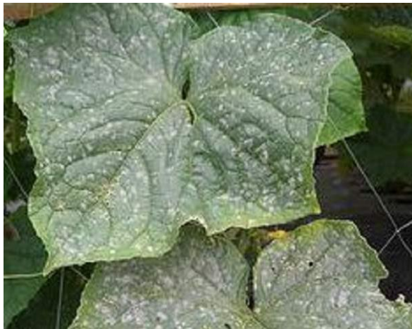
図 4. キュウリのうどん粉病

真菌病の防除は殺菌剤の散布が一番有効な手段である。ただし、殺菌剤の種類が多く、対応する菌（病気）の種類も違うので、どんな病気に効果があるかをしっかり確認してから使用する。