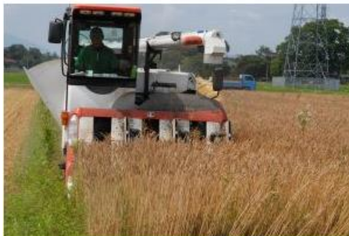
図 6. 自脱コンバインによる小麦収穫

わが国では小麦の収穫は主に稲・麦兼用の自脱コンバインを使用する。自脱コンバインは刈取りの同時に小麦をわらからもぎ取る(脱穀)ことができるので、作業効率が高い。また、脱穀したわらを結束・放出または切断・散布する機能も付いている。ほかに普通型コンバインを使うこともある。図 6 は自脱コンバインによる小麦収穫の写真である。