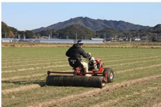
図 4. 麦踏み作業