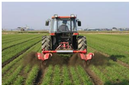
図 5. 中耕培土作業