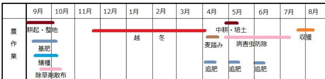
図 2. 北海道の秋播き小麦栽培暦