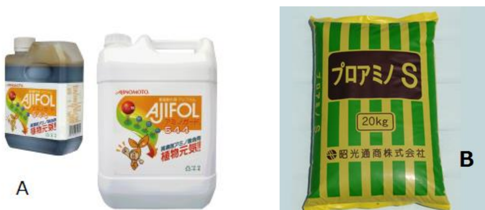
図 3. 発酵法でアミノ酸を生産する工程の残液を原料とするアミノ酸肥料

図 3 は糖蜜などを原料にして微生物発酵でアミノ酸を生産する際に発生したアミノ酸残液を原料とするアミノ酸肥料の写真である。A は液肥タイプ、アミノ酸濃度 15%以上もある。B はアミノ酸残液を添加して造粒した固形の化成肥料である。