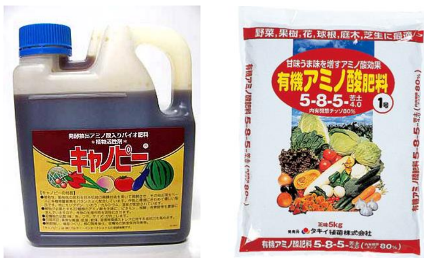
図 4. 動植物原料を発酵させたものを原料とするアミノ酸肥料

うだけで、一部は黒糖などを添加することもある。保証成分はアミノ酸ではなく、配合している化学肥料から由来するものが多く、肥料登録も液体複合肥料として登録されることに注意すべきである。なぜならば、アミノ酸だけのものが肥料として認められず、肥料登録できないためである。