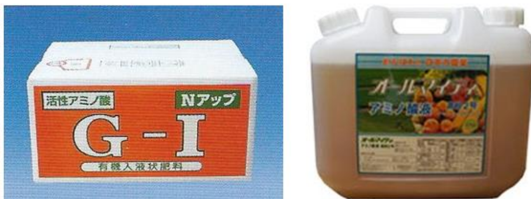
図 2. 動物性蛋白質の加水分解液を原料とする液肥

② 微生物発酵で生成したアミノ酸を使うもの。コストの面では食品や飼料用アミノ酸の精製工程に発生した残液を使用することが多い。その特徴は単一のアミノ酸または数種類のアミノ酸だけで組成され、異物が少なく、アミノ酸含有量も高い。